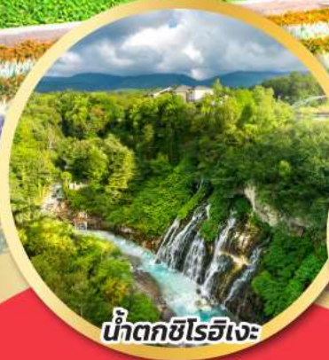
น้ำตกชิโรอิเงะ