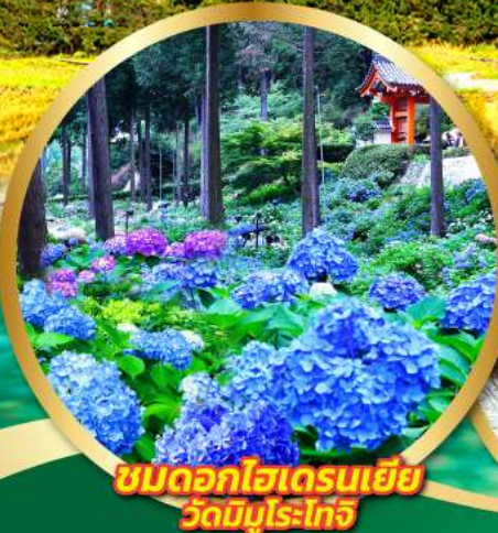
ชมดอกไฮเดรนเยีย วัดมิมุโรโงจิ