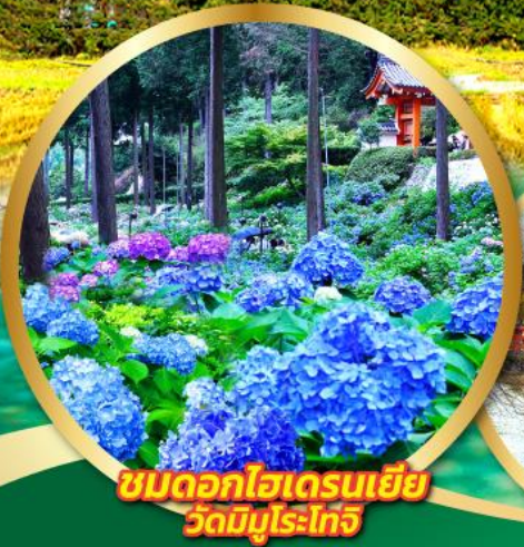
ชมดอกไม้เดรนเยี่ย วัดมิมุโระโทจิ