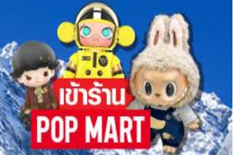
เข้าร้าน POP MART