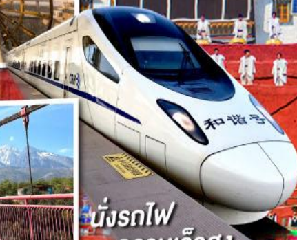
นั่งรถไฟ ความเร็วสูง