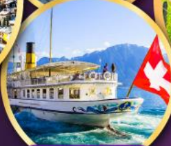
ล่องเรือทะเลสาบเจนีวา