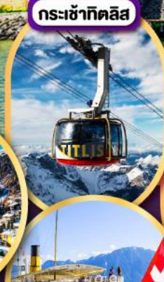
กระเช้ากิตลิส