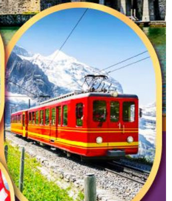
รถไฟผู้ยอดเขาจุงเฟรา