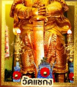
วัดไผ่ขวาง