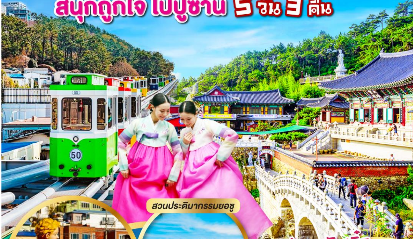
สวนประติมากรรมยอซู