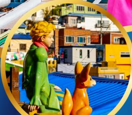
หมู่บ้านวัฒนธรรมคิมซอน