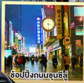
ช้อปปิ้งถนนชุนชี่ลู่