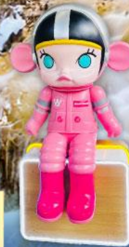
เริ่มต้น