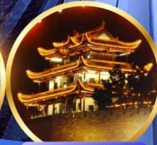
หอคอยทองคำเทียนซิน