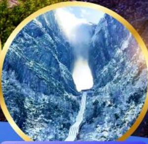
ประตูลสวรรค์ เทียนเหมินซาน