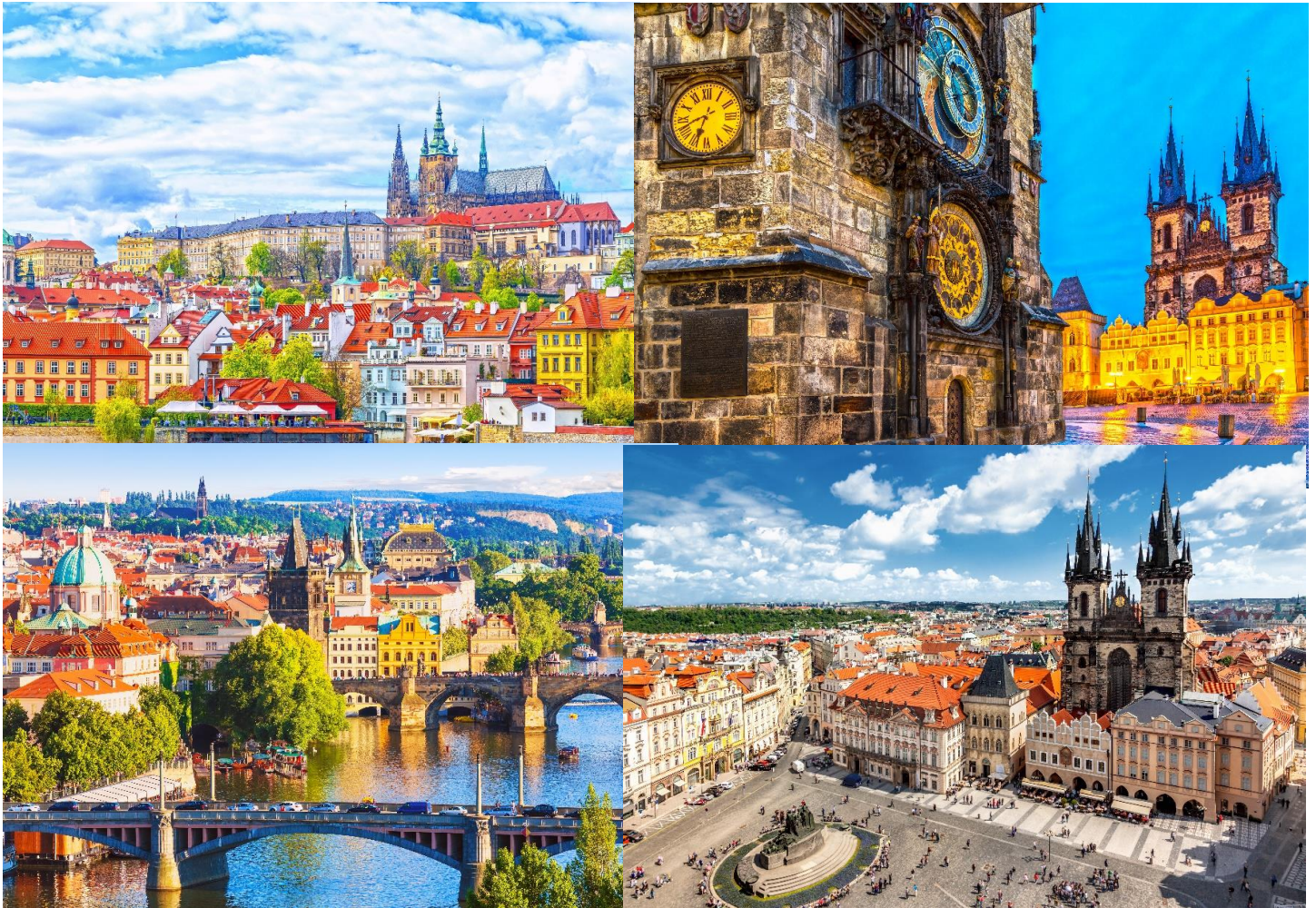
สวยงามและยังตีบอเวลาทุกๆ ชั่วโมง ให้เวลาท่านเดินอิสระเดินเล่นย่านเมืองเก่า ให้ท่านได้เลือกซื้อสินค้าพื้นเมือง เช่น เครื่องแก้วโอบีเมีย

บ่าย จากนั้นน่าจะเดินทางสู่ กรุงปราก (Prague) เมืองหลวงของประเทศสาธารณรัฐเช็ก อดีตเมืองหลวงของสาธารณรัฐเช็กโกสโลวาเกีย ซึ่งได้สมญานามมากมาย เช่น นครแห่งปราสาท และโรมแห่งอุดรทิศ จากนั้นนำท่าน ชมปราสาทแห่งปราก (Prague Castle) ที่สร้างขึ้นอยู่บนเนินเขาตั้งแต่สมัยคริสต์ศตวรรษที่ 9 ในสมัยเจ้าชาย Borivoj แห่งราชวงศ์ Premyslid ซึ่งปัจจุบันเป็นทำเนียบประธานาธิบดีมาตั้งแต่ปี ค.ศ.1918 ชมมหาวิหารเซนต์วิตุส (St.Vitus Cathedral) อันงามสง่าด้วยสถาปัตยกรรมแบบโกธิคในสมัยศตวรรษที่ 14 นับว่าเป็นมหาวิหารสไตลโกธิคที่ใหญ่ที่สุดในกรุงปราก ซึ่งพระเจ้าชาร์ลที่ 4 โปรดให้สร้างขึ้นในปี ค.ศ.1344 ภายในเป็นที่เก็บพระศพของกษัตริย์สำคัญในอดีต เช่น พระเจ้าชาร์ลที่ 4, พระเจ้าเฟอร์ดินานด์ที่ 1 และ พระเจ้าแมกซิมิเลียนที่ 2 เป็นต้น ชมพระราชวังหลวง (Royal Palace) ที่เป็นหนึ่งในส่วนที่เก่าแก่ที่สุดของปราสาท ใช้เป็นที่ประทับของเจ้าชายโอบีเมียทั้งหลาย