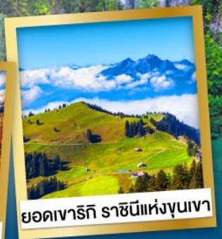
ยอดเขารัถิ ราชนิแห่งขุนเขา