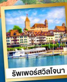
ริวีเออร์สาลิโซนา