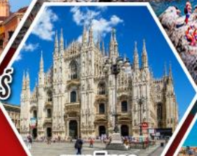
มหาวิหาร ดูโอโมแห่งมิลาน