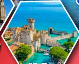
ซิร์มิโอนี่

• อุทยานโดโลไมท์ • นั่งกระเช้าสู่ยอดเขาแอลปี ดิซุสซาเซ • ดินแดนห้ำหามูบ้านซังควาทอร์ส