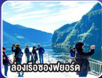
ล่องเรือของฟยอร์ด