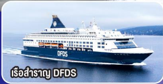
เรือสำราญ DFDS