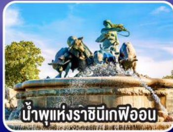
น้ำพุแห่งราชินีแกพ็อน