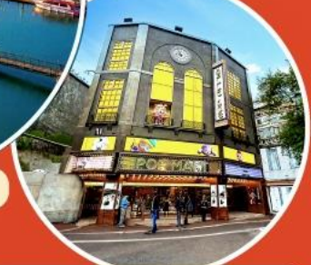
ร้าน POP MART ใหญ่ที่สุดในไต้หวัน