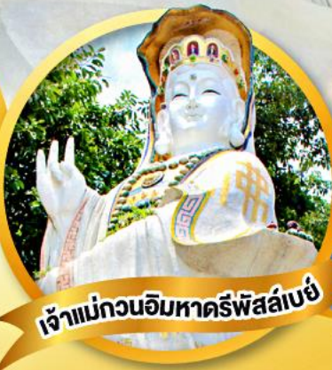
เจ้าแม่กวนอิมหาดรีฟส์ลีย์