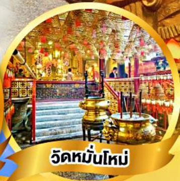
วัดหมื่นใหม่