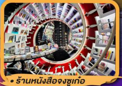
• ร้านหนังสือจิงซูเก้อ