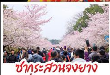
ซากุระสวนจงยาง