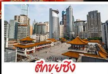
ตึกบูชชิง