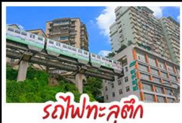
รถไฟฟ้าทะลุศึก

รถไฟฟ้าทะลุศึก - คักย่านหงหยาดัง จัตุรัสราฟเฟิล - ซากุระ สวนจงยาง ตึกบูชชิง - วันอิสระช้อปปิ้งหรือเที่ยวอู่หลง