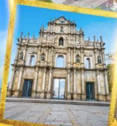
วิหารเซนต์ปอลเซนต์ปอล