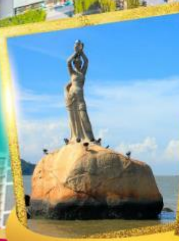
จูไห่พีชเชอร์เกิร์ล