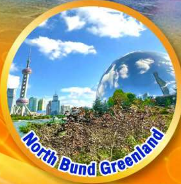
North Bund Greenland