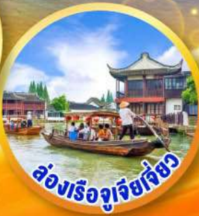
ล่องเรือซูเจียเจี๋ย