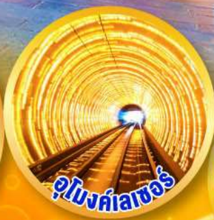
อุโมงค์เมโทร