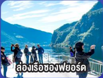
ล่องเรือชมความงามของฟยอร์ด