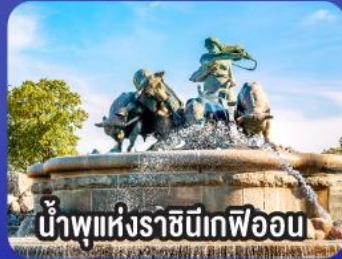
น้ำพุแห่งราชินีเคฟฟอน

เริ่มต้น 95,900 ห้องพักแบบ SEA VIEW 16-25 ก.ย. 67 11-20, 18-27 ต.ค. 67