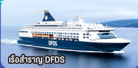
เรือสำราญ DFDS