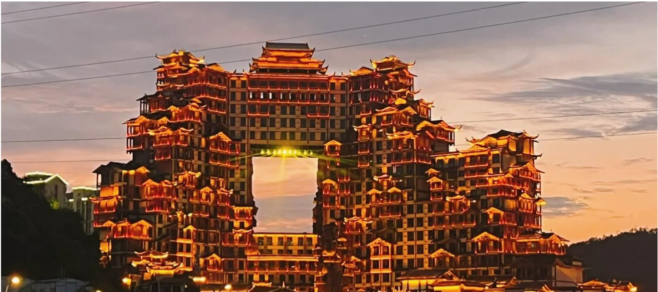
ที่พัก COUNTRY GARDEN PHOENIX HOTEL หรือเทียบเท่าระดับ 5 ดาว (มาตรฐานประเทศจีน)

วันที่สี่ เมืองโบราณฟูหรงเจิน – น้ำตกฟูหรงเจิน – เมืองโบราณเฟิงหวง – บ้านเกิดกวีเสียนฉงเหวิน – ล่องเรือแม่น้ำถั่วเจียง – สะพานสายรุ้ง