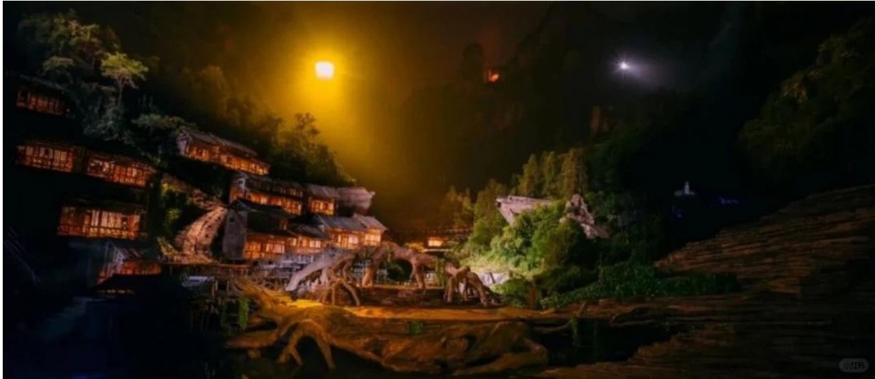
ที่พัก COUNTRY GARDEN PHOENIX HOTEL หรือเทียบเท่าระดับ 5 ดาว (มาตรฐานประเทศจีน)

วันที่สาม เขาอวตาร (ลิฟต์แก้วชาจีน) - เขาเทียนจื่อชาน (กระเช้าชาลง) - จุดชมวิวยานเจียเจี๋ย - แกรนด์แคนยอนจางเจียเจี๋ย (VR4D) + สะพานแก้ว - ดิสมท์เจอร์รี่ 72 ชั้น