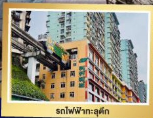
รถไฟฟ้ามะลิค