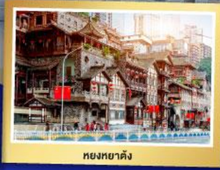
หยงหยาดัง