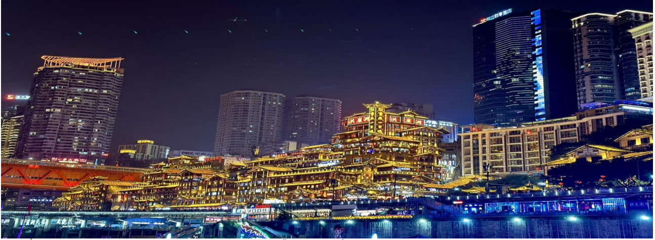
ที่พัก HONGLOU YINXING HOTEL หรือระดับเทียบเท่า 4 ดาว

ดี อีกทั้งยังเป็นจุดถ่ายรูปที่สำคัญของนักท่องเที่ยวอีกด้วย