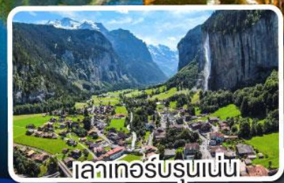
อินเทอร์ลาเคน