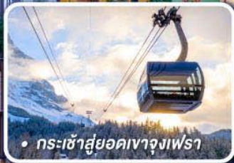
• กระเช้าสู่ยอดเขาจุงเฟรา