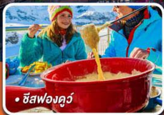
• ชีสฟองดูว์