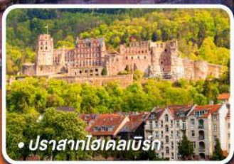
• ปราสาทไฮเคลเบิร์ก