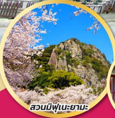
สวนมิฟูเนะยามะ