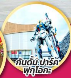
กันดั้ม ปาร์ค ฟุคุโอกะ