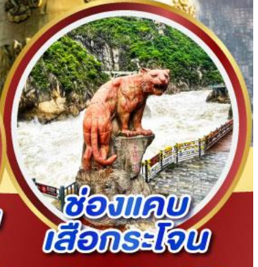
ช่องแคบ เสื่อกระโจน