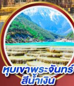
หุบเขาพระจันทร์ สีน้ำเงิน