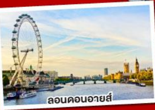
ลอนดอนอายส์