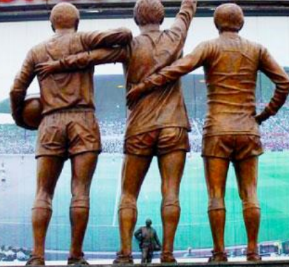
Old Trafford - 100 y