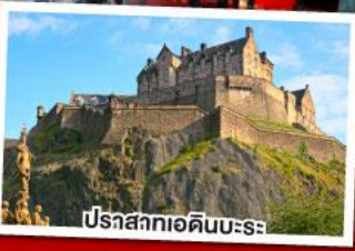
ปราสาทเอดินบะระ