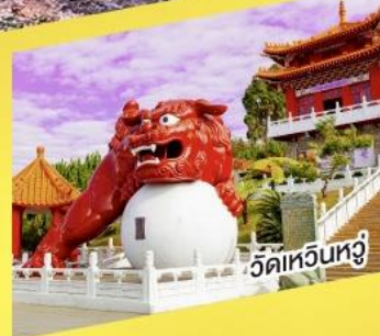
วัดไต้หวันหู