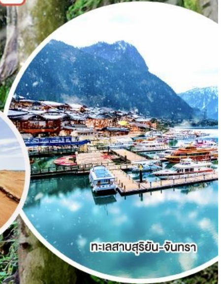
ทะเลสาบสุริยอัน-จันตรา