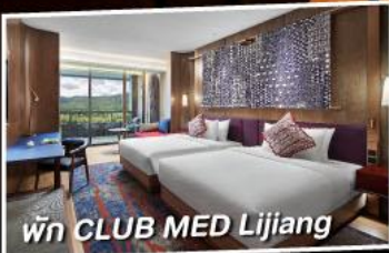
พัก CLUB MED Lijiang