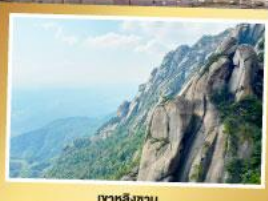
เขาหลงซาน