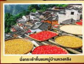
นั่งกระเช้าขึ้นชมหมู่บ้านหวงหลิง