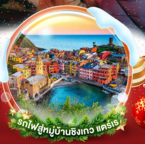
รถไฟสู่หมู่บ้านซิงเกว แครร์

สุดแสนจะโรแมนติกกับตลาดคริสต์มาส 3 เมือง สตราสบูร์ก บาเซล เวโรน่า