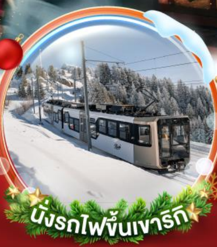
นั่งรถไฟขึ้นเขารัก