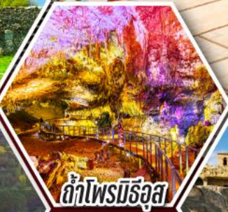
ลำไฟรมีร์จูล