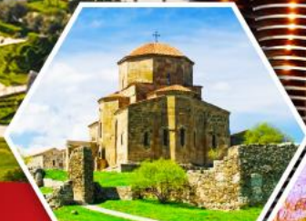
วิหารจวารี