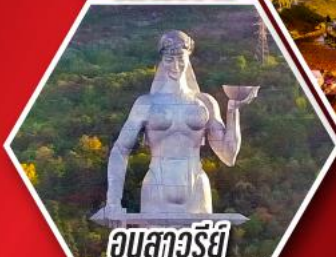
อนุสาวรีย์