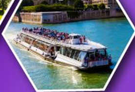
ล่องเรือบาโตมุซ ชมกรุงปารีส

เที่ยวเมืองวาอูซ เมืองหลวงของสาธารณรัฐ ลิกเทนสไตน์