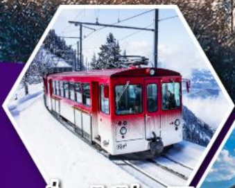
นั่งรถไฟใต้เขาริกิ