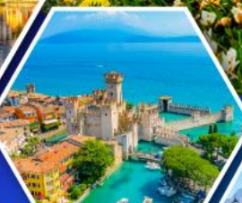
ซีร์มิโอนี