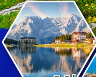
ทะเลสาบมิสุร์น่า