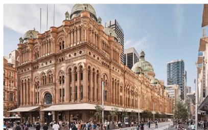
ควีนวิกตอเรียมิลดิง