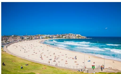
หาดบอนดิ