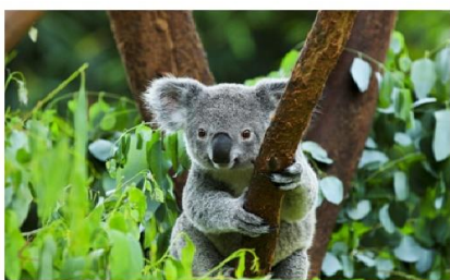
โคอาล่าปาร์ค