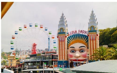
สวนสนุกลูน่า พาร์ค ซิดนีย์