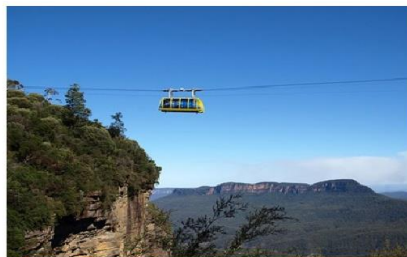
ขึ้นกระเช้าลอยฟ้า