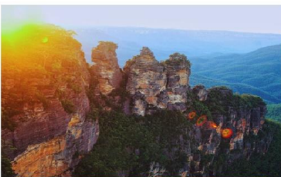
หุบเขาสีน้ำเงิน