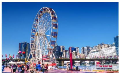
คาร์ลิ่งฮาร์เบอร์