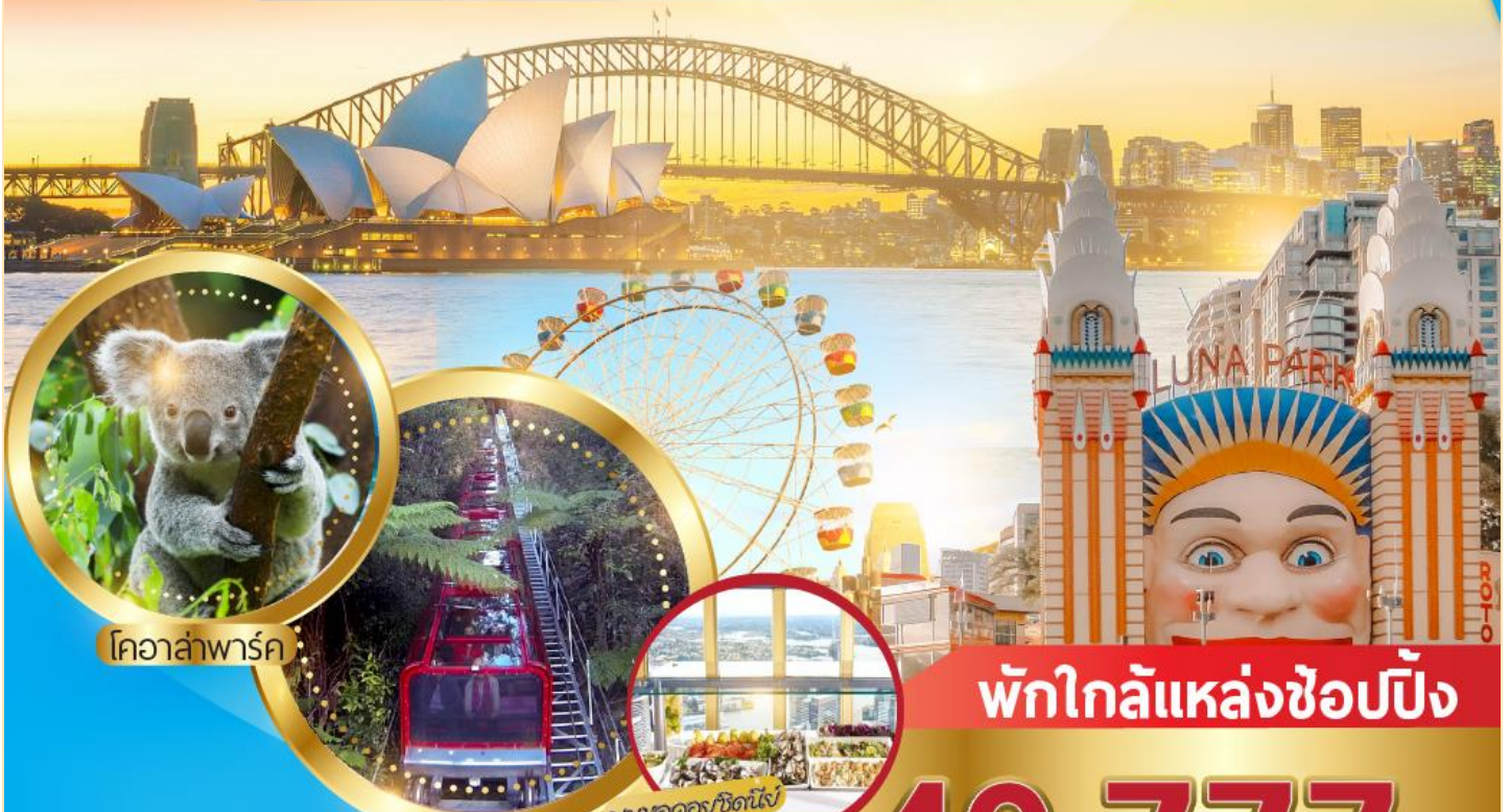
โคอาล่าพาร์ค

เช็กอิน สนุกสนาน พาร์ค ล่องเรืออ่าวซิดนีย์