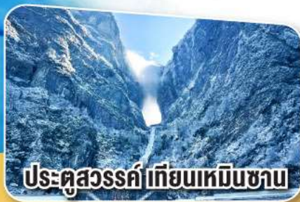
ประตูสวรรค์เทียนเหมินชาน