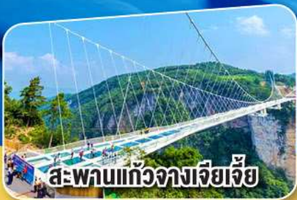
สะพานแกว่งจางเจียเจีย