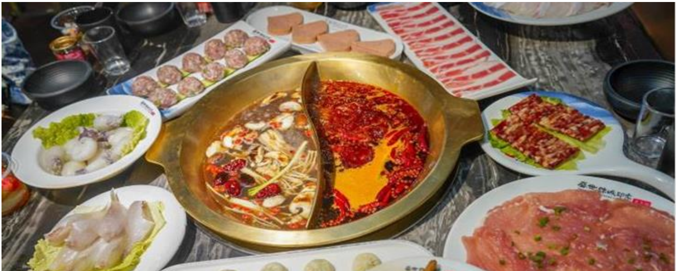
GO1TFU-TG008 Snow Winter เฉิงตู สี่ตรุนี ปีเผิงโก่ ท่ากู่ปิงชวาน จิวจ้ายโกว 7 วัน 6คืน (นั่งรถไฟความเร็วสูง) *ไม่ลงร้านช้อป/รวมรถเหมา* โดยสายการบิน Thai Airways (TG)

ที่พัก Hangchen International Hotel หรือระดับเทียบเท่า 4 ดาว (มาตรฐานจีน)