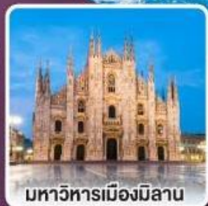
มหาวิหารเมืองมิลาน