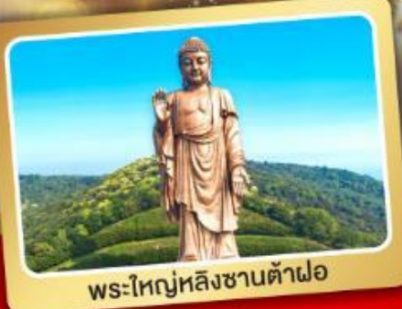
พระใหญ่หลังซานต้าฝอ