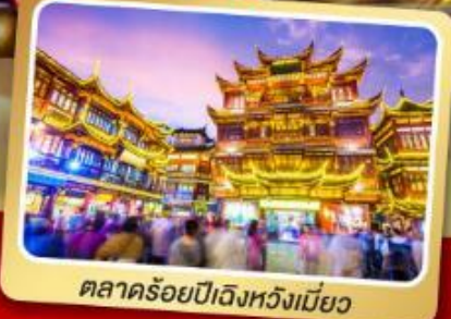
ตลาดร้อยปีฉงหวังเหมียว