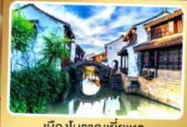
เมืองโบราณเฉี่ยเหอ