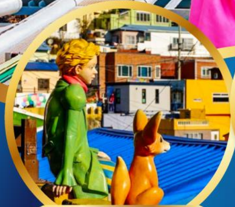
หมู่บ้านวัฒนธรรมคิมซอน

นั่งรถไฟจิ๋ว "สกาย แคปซูล" (Sky Capsule)