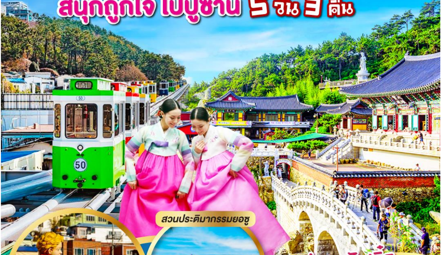
สวนประติมากรรมยอซู

นั่งรถไฟจิ๋ว "สกาย แคปซูล" (Sky Capsule)