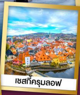
เซสกีครุมลอฟ