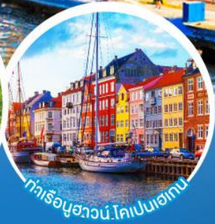
ท่าเรือชวอน์โคเปเนอเกน