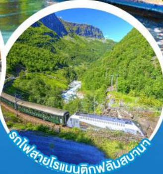
รถไฟสายโรแมนติกฟลัมสบานา