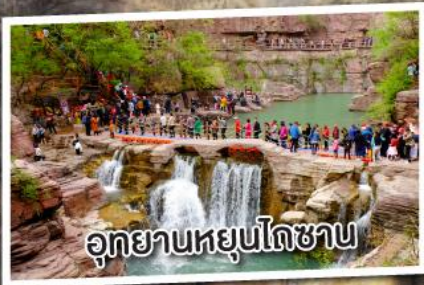
อุทยานหยุนโกซาน