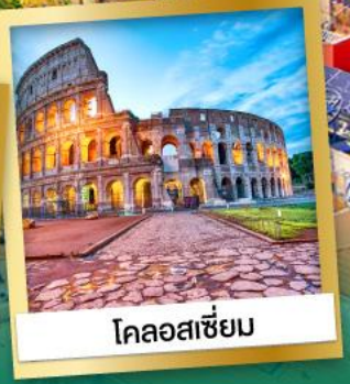
โคลอสเซียม