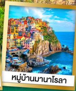
หมู่บ้านมานาโรลา