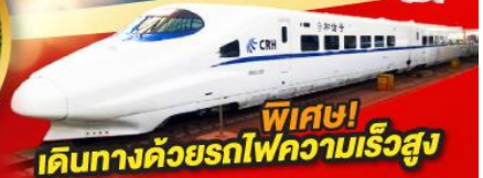
พิเศษ! เดินทางด้วยรถไฟความเร็วสูง