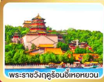
พระราชวังฤดูร้อนอี่เหอหยวน