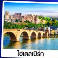
ไฮเดิลเบิร์ก