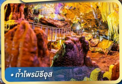
• ถ้ำไฟรมิธิอุส