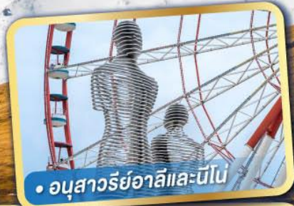
• อนุสาวรีย์อาลีและนีโน