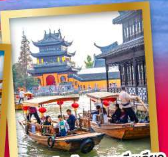
ล่องเรือเมืองโบราณจูเจียเจียว