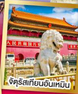
จัดรูปปั้นอันเหมือน