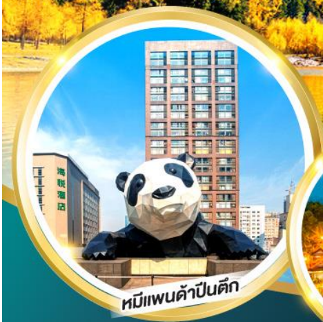
หมี่แพนด้าปิ่นตึก